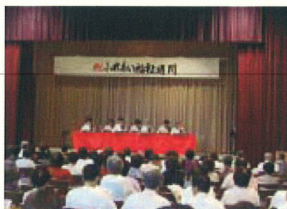
(演芸大会「大正琴の演奏」)