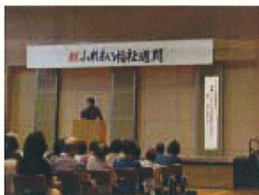
(講演「生きがいについて」)