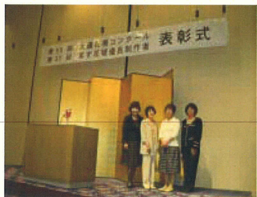
(表彰後にハイ・チーズ)