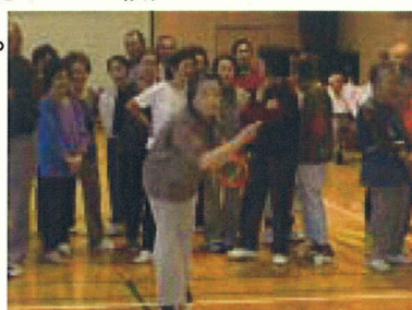
(狙いを定めて エイツ!)